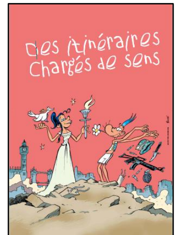
6 panneaux d'exposition sur la flamme olympique et le relai