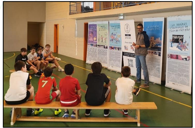
6 panneaux d'exposition