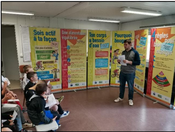
12 panneaux d'exposition répartis dans 3 thématiques : manger – bouger – dormir