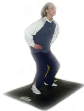
Tapis de Bosco