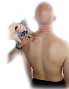
Pince masse grasse