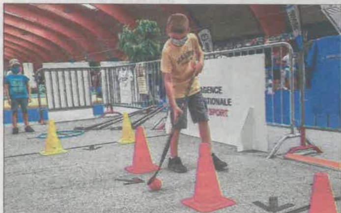
Les plus jeunes peuvent s'initier au hockey.

Sportissimo, zone de loisirs des Résidences à Belfort. Aujourd'hui, de 10 h à 18 h. Gratuit. Masque obligatoire.