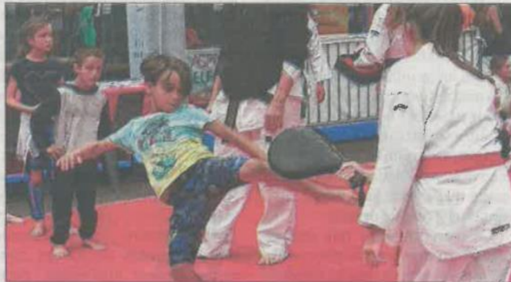
Les démonstrations et initiations seront moins nombreuses que les années précédentes, mais toujours au programme.

« Les associations ont été consultées et 60 % étaient demandeuses. Au fil des mois, les mesures sanitaires ont évolué, mais jeudi dernier, nous avons eu la certitude, de la part de la préfecture, de