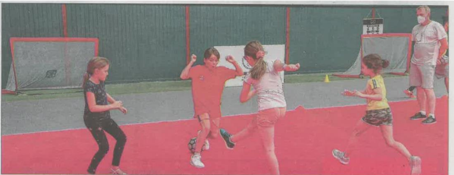
Le salon des sports du Territoire de Belfort Sportissimo a accueilli 36 associations et 3 000 visiteurs.