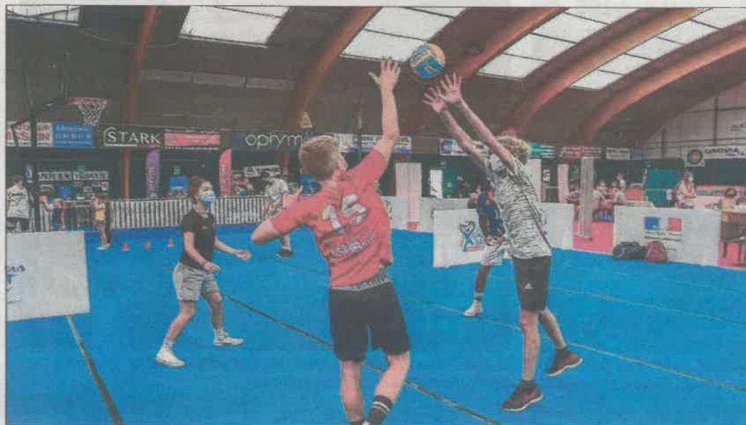
En volley « la même équipe monte les poteaux, le filet, sort les ballons et assure le rangement. Les ballons sont désinfectés ».

En volley, « les joueurs doivent porter le masque lorsqu'ils se croisent », détaille Simon Brun, coordinateur sportif. « On limite les contacts, on ne se touche pas, mais on a l'habitude de multiplier les petits gestes de contact (tapes dans les mains, claques sur les épaules), qui seront proscriés. » Simon s'attend « à une baisse de 15 % des pratiquants », mais se réjouit toutefois de « l'arrivée de trois nouvelles féminines ». Il compte sur la « vitrine » que fournira l'accueil de l'équipe de France à Belfort, entre le 26 décembre et 14 janvier.