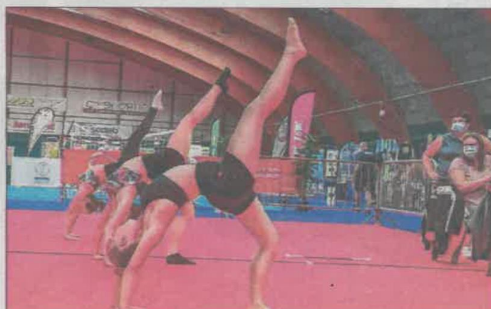
Démonstration de twirling bâton à l'intérieur des tennis couverts.